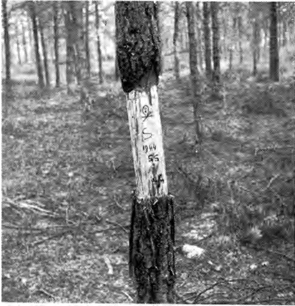
De boom waartegen de twee SS'ers in het krijtsgevangenkamp van de KP-Helden, geliquideerd werden. (Zie pag. 144.)