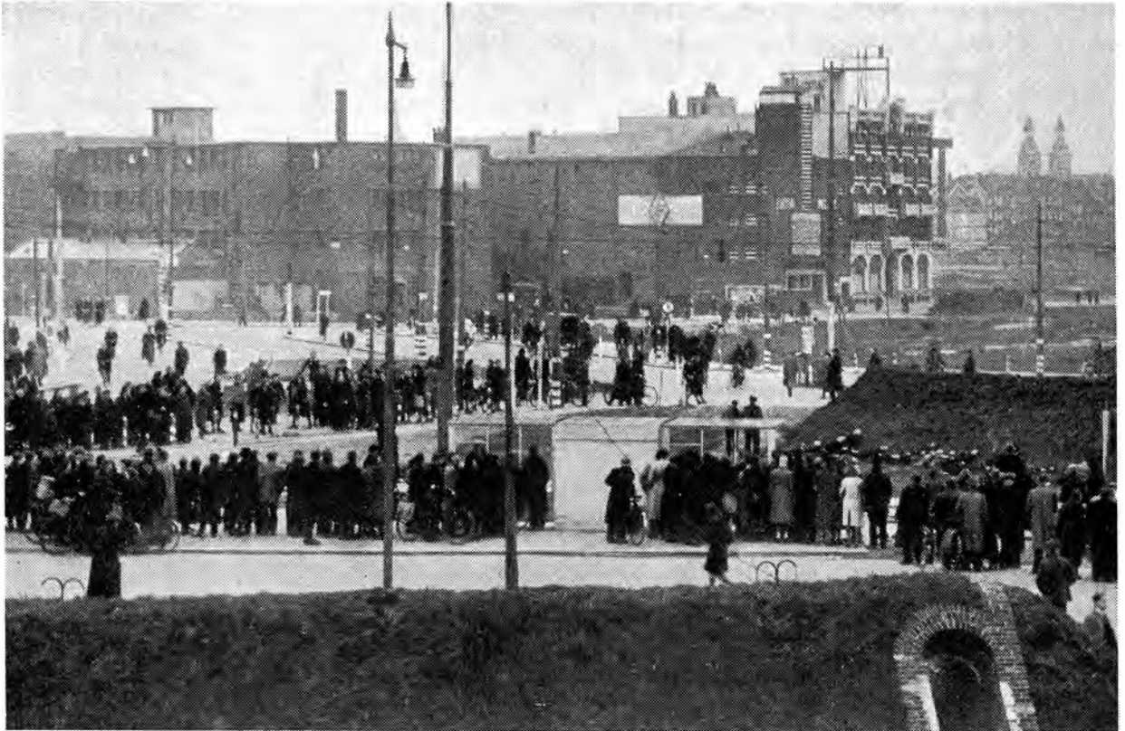
Op het Hofplein te Rotterdam fusilleerden de Duitsers 20 illegale werkers tegen de helling van een schuilkelder. Zij lieten de lijken liggen om de bevolking angst aan te jagen. Een KP'er maakte deze clandestiene foto.