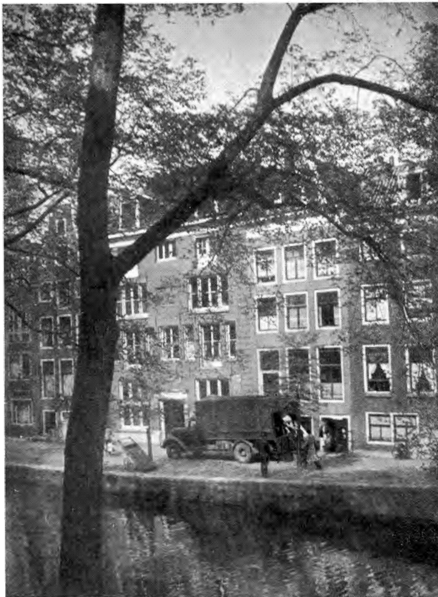
Op 17 April '45 vond een overval plaats op het hoofdkwartier van de KP-Amsterdam aan de Leidsegracht 36. De overvalwagen staat voor en de gevangenen worden juist ingeladen.

Nu waren er drieschuilplaatsen in huis, die alle drie op hun bruikbaarheid waren gekeurd door de politie. Eén ging door voor onvindbaar, terwijl twee andere als matig waren opgegeven. De goede schuilplaats (de zgn. engelenbak) was gebouwd op een slaapkamer en besloeg een hele muur. De lengte was plm. 2 meter, de breedte ongeveer 70 cm, terwijl de hoogte 2\frac{1}{2} à 3 meter was. De ingang was in een daarvoor staande kleerkast en werd afgesloten door een zwaar valluik. Door middel van een luchtkoker was er ventilatie in deze ruimte. Juist op tijd konden zes personen zich hierin verbergen. Het waren: tante Mary en tante Martha (twee Jodinnen), Eussi en Ronni (twee Joden), Hans en Arnold. Het luik was nog maar net dicht, toen haastige voetstappen en schreeuwstemmen de aankomst van de overvallers meldden op de