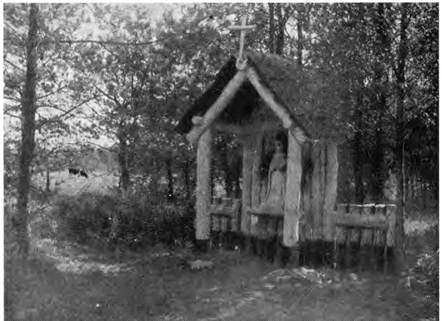
Kapel ter ere van Onze Lieve Vrouwe van den Goeden Duik, in Augustus '43 door enkele leden van het Brabantse studentengilde van Onze Lieve Vrouwe op de duikbasis „Moerle” in de omgeving van Tilburg gebouwd.

Het Kerstfeest was voor de ondergedokenen de zwaarste beproeving van hun heimwee naar huis en naar de Kerstviering met de hunnen. Steeds en overal hebben de plaatselijke medewerkers tezamen met de geestelijkheid er alles op gezet, om dit innige feest met de onderduikers zo waardig mogelijk te vieren. Overijsel geeft hiervan een voorbeeld uit 1943. De protestanten hadden een avondwijding in het gymnastieklokaal te Broekland onder Raalte. De onderduikers waren om zes uur gewaarschuwd, dat om tien uur de plechtigheid zou zijn, en ze kwamen, zeventig in getal, in een zaal, die stemmig met sparren-groen was versierd en waar de Raaltese dominé den kerkdienst leidde. Daar klonken de Kerstgezangen, terwijl vliegtuigen naar Duitsland en weer op den terugtocht daarvan overvlogen, een weinig vredig geluid, dat niettemin altijd zo nauw verweven was met de hoopvolle gedachte aan het naderbij komen van den val der boze machthebbers in Duitsland, die zoveel ellende over de