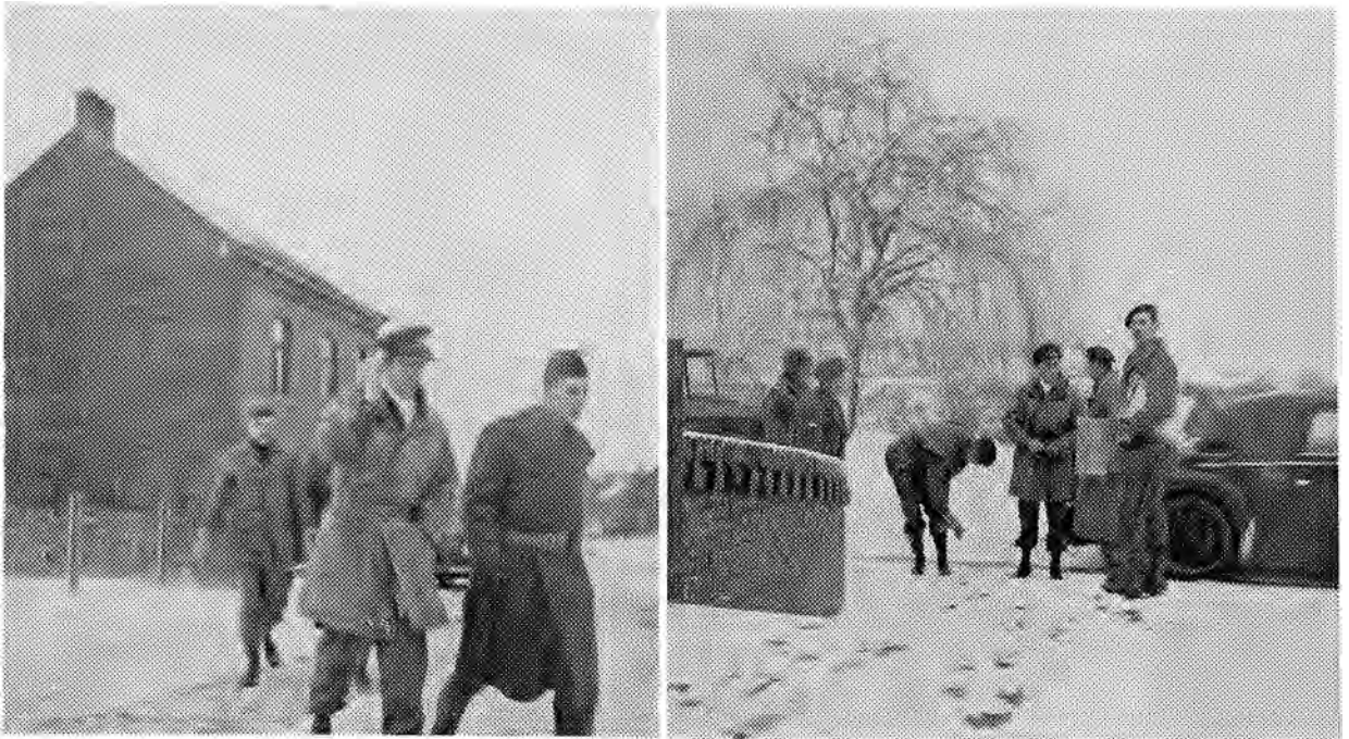
Z.K.H. Prins Bernhard houdt een inspectietoelt.