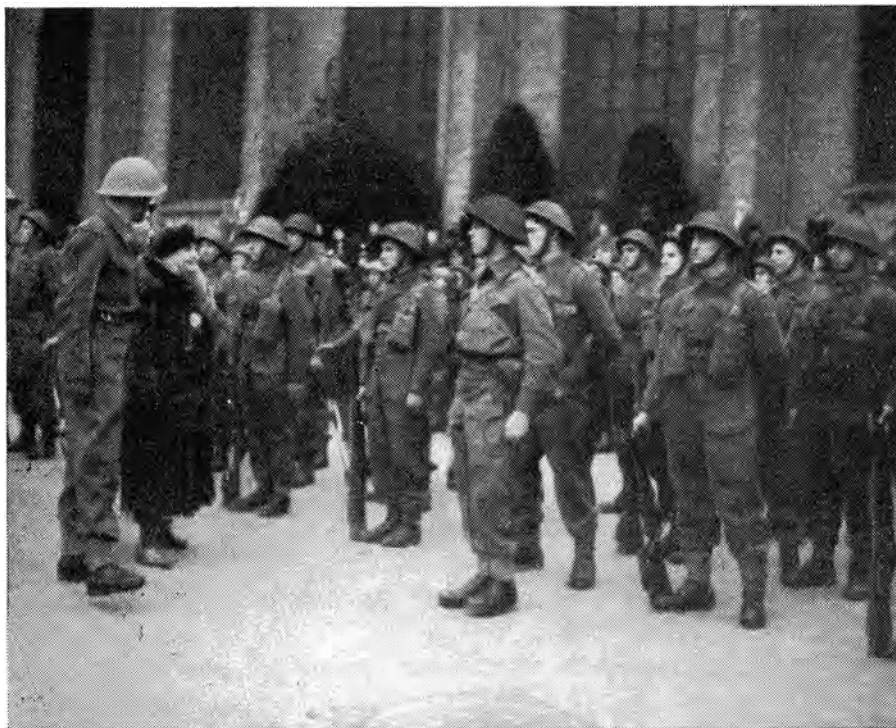
Op 18 Maart '45 bracht H.M. Koningin Wilhelmina een bezoek aan Tilburg, waarbij zij het IIe Bataljon van het Commando-Brabant inspecteerde en op ongedwongen en hartelijke wijze tot vele stoottroepers een bemoedigend en waarderend woord sprak.

betekende nieuwe vernietiging, hogere puinhopen, voortdurende onderdrukking, verscherpte terreur, meer doden. Het was een zwaar begin, een haast hopeloze taak, doch er moest gehandeld worden, dwars door teleurstellingen en moeilijkheden, door wanbegrip en tegenwerking heen. Het werden handelingen en gebeurtenissen, die niet in de dagbladen vermeld stonden; wachtkloppen, verkennen, patrouille lopen, in contact komen met vijandelijke voorposten, vuurgevechten. En dat alles onder de meest ongunstige omstandig-