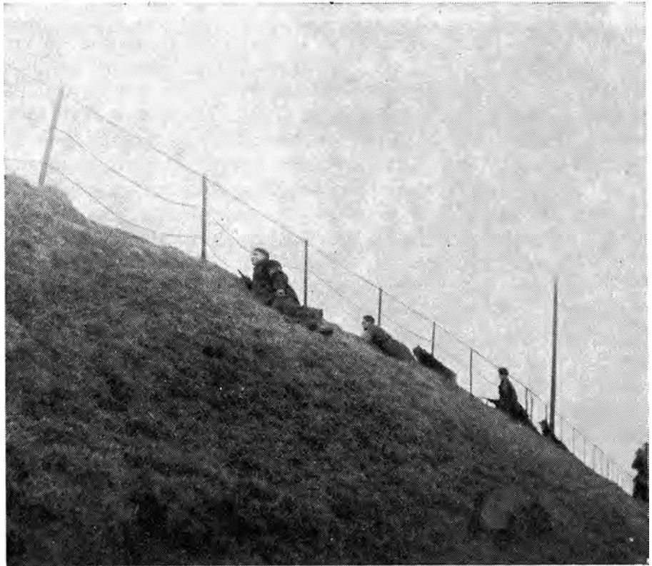
„De mannen van het eerste uur”. Leden van de KP-Maas en Waal, onmiddellijk na hun bevrijding overgegaan tot de Stoottroepen, houden in burgerkleding de wacht aan de Waaldijk. Zie tekst.

Venlo. Tijdens het Ardenneoffensief en later als gevolg van de slag in het Rijnland, verdwijnen de geallieerde onderdelen en wordt de bewaking op sommige punten geheel aan de Stoottroepen overgelaten. Van het Ie bataljon trekt de Margriet-compagnie — ook in dit verband nog met haar oorspronkelijke naamaangeduid — als enige Brabantse compagnie met de geallieerden Duitsland in. Gedurende een verblijf in Kleef krijgt Stefke, de commandant van de Margriet-compagnie, een op een brief met het stadswapen van 's Hertogenbosch gedrukte officiële uitnodiging,