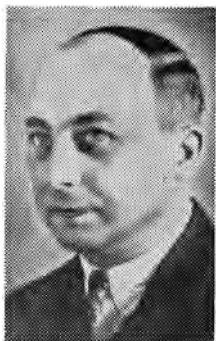
Nicolas Bruin Huisvesting KP.