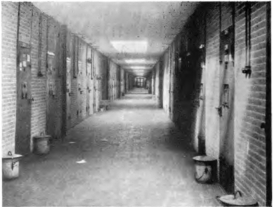
Het Oranjehotel te Scheveningen zat regelmatig vol met illegale werkers. Men ziet hier een cellengang. De tonnen staan buiten de deur.