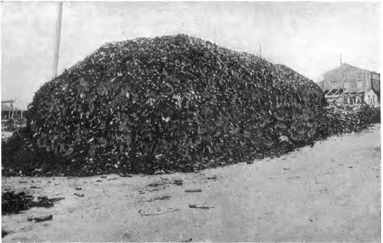
Het laatste van de tienduizenden gevangenen, die in het concentratiekamp omkwamen: een berg van schoenen. Dit lugubere beeld werd door de geallieerden bij hun bevrijding in een der Duitse concentratiekampen aangetroffen.

ding. Dit is van kerkelijke zijde soms zeer goed begrepen. In de Mededelingen, bestemd voor KP'ers in Limburg en verspreid tijdens de bezetting, komt met de aantekening zeer voornaam de volgende opmerking voor: