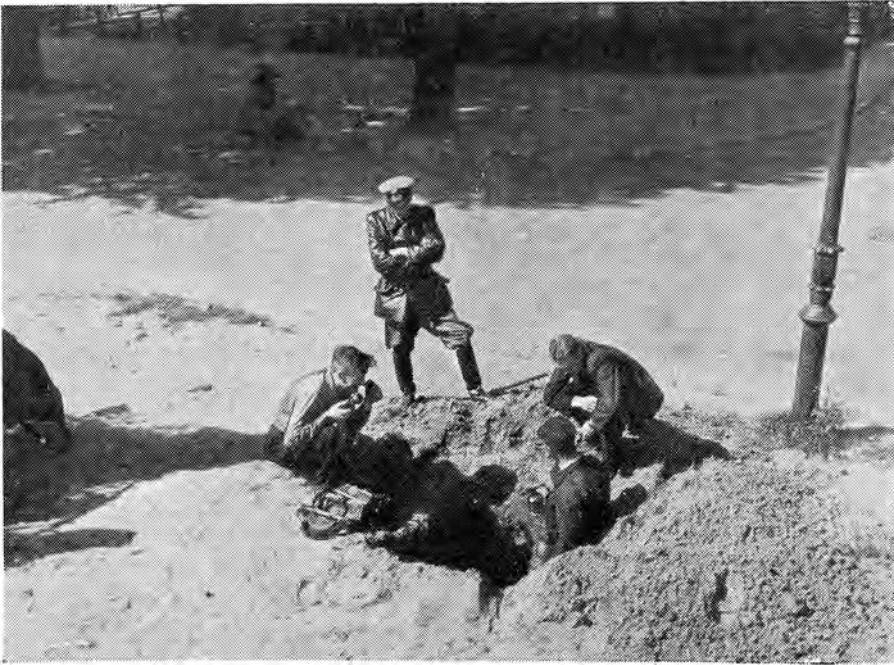
Een reconstructie van na de oorlog. Maar zo is 't toch ook in de oorlog gebeurd. PTT-mannen lassen een nieuwe verbinding in een telefoonkabel, en een Duitse officier kijkt belangstellend toe. Maar de verbinding was er een voor de illegaliteit, en de mannen waren illegale werkers van de CID.

organiseren. Van de contra-spionage, die ook op het programma stond, kwam vrijwel niets terecht.