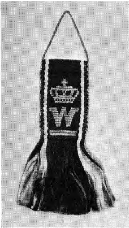
Een door onderduikers gemaakt hangertje in de nationale kleuren. In vrijwel dezelfde uitvoering werden eveneens een groot aantal boekenleggers vervaardigd.

De grote zorg van de LO om haar onderduikers te werk te stellen werd dikwijls verlicht door persoonlijke initiatieven. In Hoogeveen was een timmerfabriekje dat bij voorkeur onderduikers als knechts nam en toen de ondernemer op deze wijze meer knechts kreeg dan hij kon gebruiken zette hij een meubelfabriekje op, dat in dien tijd, waarin er zoveel tekort aan huisraad ontstond, uitstekend floreerde. In Nijverdal weer werden onderduikers, die men niet in hun vak had kunnen plaatsen, aan de fabricatie van strotassen gezet: drieduizend gevlochten strotassen gingen wekelijks de deur uit en werden verhandeld.