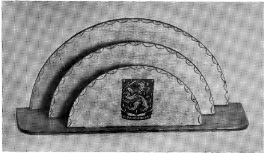
Een houten brievenstandaard door onderduikers in Groningen vervaardigd en voor drie gulden aan de man gebracht.

In de periode, waarin het onderduikerswerk het omvangrijkst en het intensiefst was en men het vraagstuk van de werkverschaffing aan de onderduikers zoveel als doenlijk was beheerste, had men de Beurs, waarover reeds verteld is. Zij was de „arbeidsbeurs” van de organisatie, men ving er vraag en aanbod op en wisselde die tegen elkander uit. Boeren en tuinders kon men er