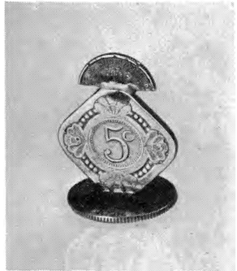
Een sigarettendoover, gemaakt uit totaal zes en een kwart cent, de populaire aanduiding en taxatiewaarde van Seyss Inquart.

De financiering van het verzet is een belangrijk en boeiend aspect ervan. Er zijn enorme bedragen mee gemoeid geweest zonder bank-conto's, zonder feitelijk administratief beheer, zonder accountantscontrôle. Het goed vertrouwen en het verantwoordelijkheidsbesef van de mensen zelf om dat vertrouwen niet te beschamen speelden een beslissende rol bij het beheer van grote bedragen. Deze eigenaardige autonomie hield een zekere vlotheid in, die in den gang van zaken ook nodig was. Het geld zat om zo te zeggen niet