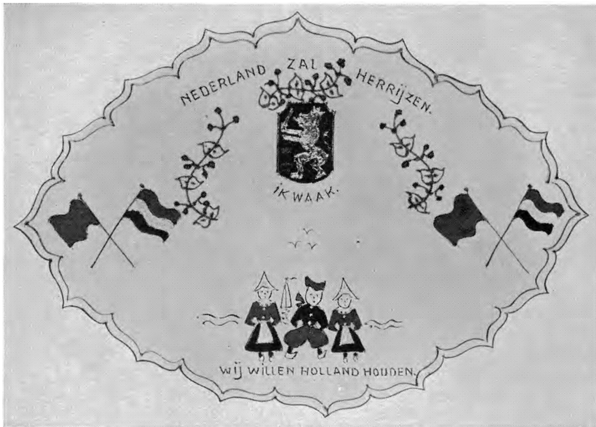
Een bedrukt klesdje, waarvan de onderduikers in Hillegersberg er plm. 6000 maakten.

Lage Mierde, Helvoirt, Oisterwijk, welke gemeenten de LO overigens ook een stroom van blanco persoonsbewijzen in handen speelden ten behoeve van thuisgekomen arbeiders uit Duitsland, die niet meer terugwilden.